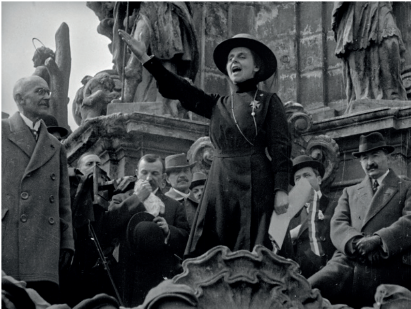
1. kép: Slachta Margit a mandátuma átvételekor tartott beszéde közben