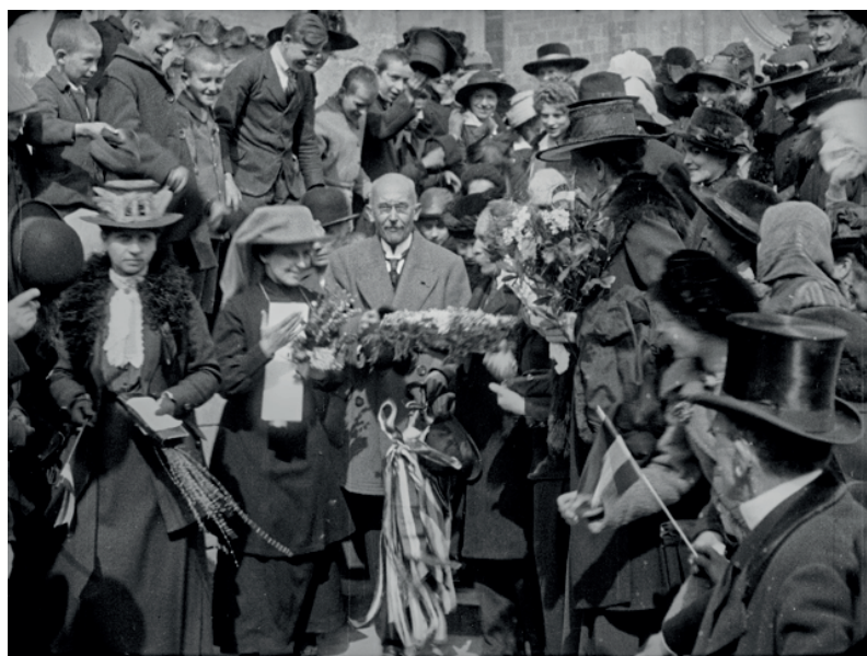
3. kép: Slachta Margit és az ünneplő tömeg