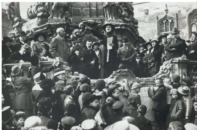
5. kép: Slachta Margit az ünneplő tömeghez beszél a Szentháromság téren