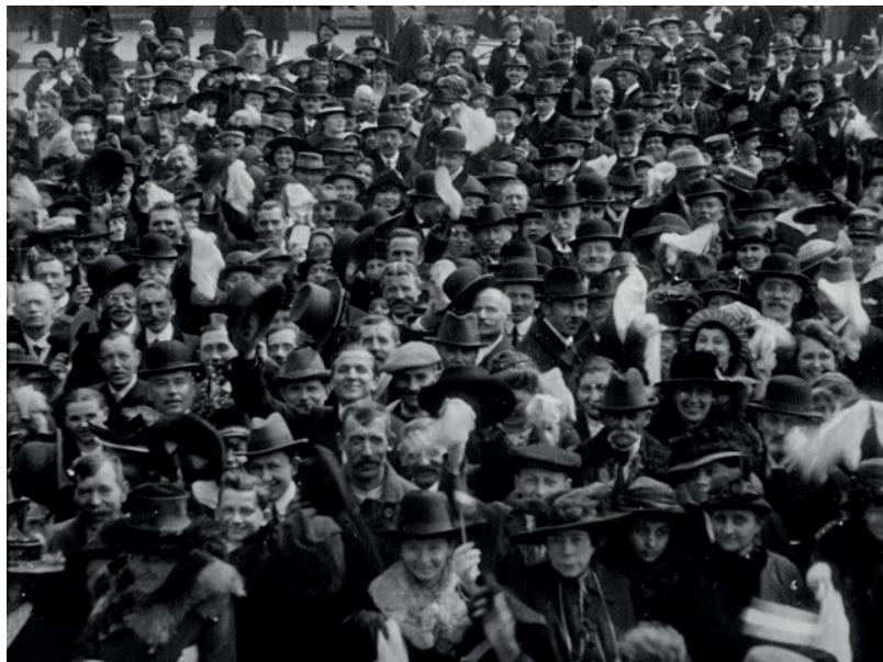
4. kép: A mandátuma átvételekor Slachta Margitot ünneplő tömeg Budán, a Szentháromság téren 1920-ban