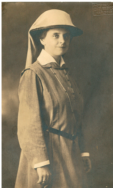
6. kép: Slachta Margit 1924-ben