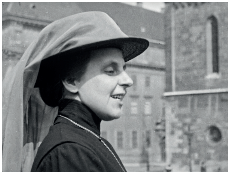
2. kép: Slachta Margit az ünneplőkhöz szól mandátuma átvételekor